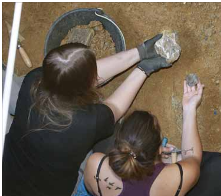
Detalles de los trabajos en el yacimiento.