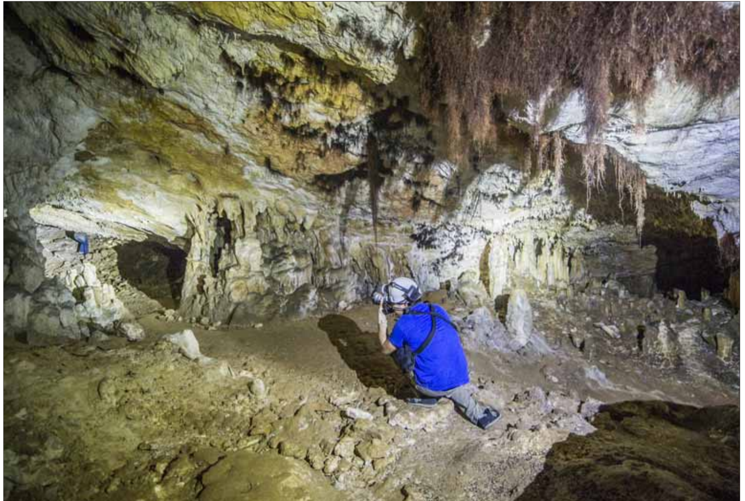
Interior de Cueva Peluda donde el agua aún está en proceso de formación de estalagmitas y la raíces de robles y quejigos llegan aquí como finos hilos.