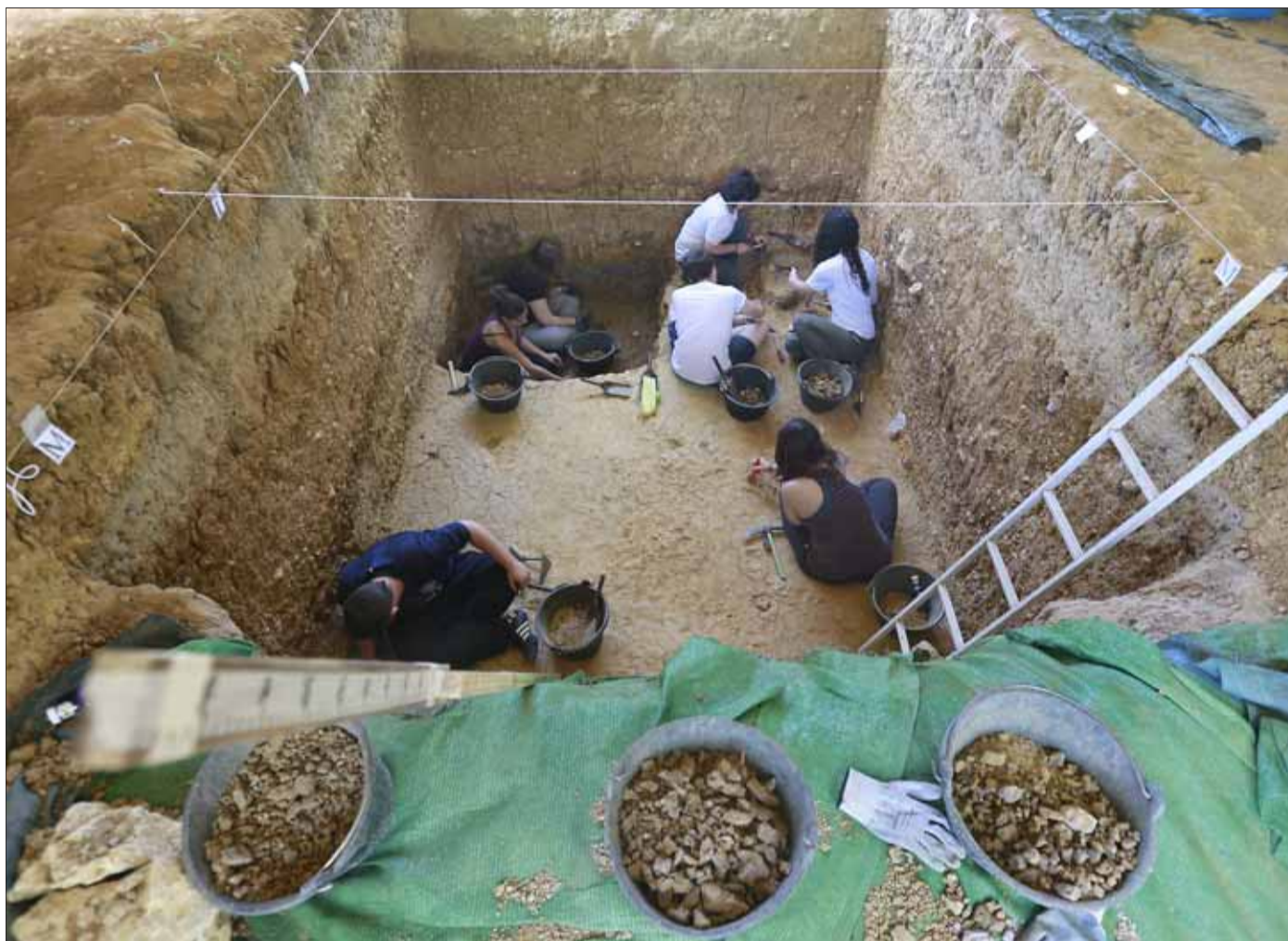
Imagen de investigadores en el interior del yacimiento.