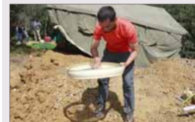
Trabajo de cribado. I. L. MURILLO

Hallazgos. Este año ha sido uno de los yacimientos protagonistas de la excavación. Se han localizado, prácticamente intacto, un taller de industria musteriense. No se han localizado las herramientas que allí fabricaban, tan sólo una que estaba rota. Pero se han encontrado los núcleos, las lascas, los percutores para golpear el sílex o para confeccionar sus hachas.