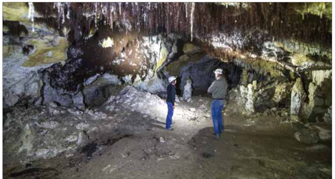
Vista general de Cueva Peluda. I. L. MURILLO

Esta cueva es muy completa y accesible porque ofrece una imagen tridimensional de las cavidades. Señala Ortega que «al estar dentro de la visita turística, al inicio de la Trinchera, no ha sido necesaria mucha infraestructura para tener una entrada y hay yacimientos muy puntuales con lo que se puede abrir sin dañar el patrimonio y además es la