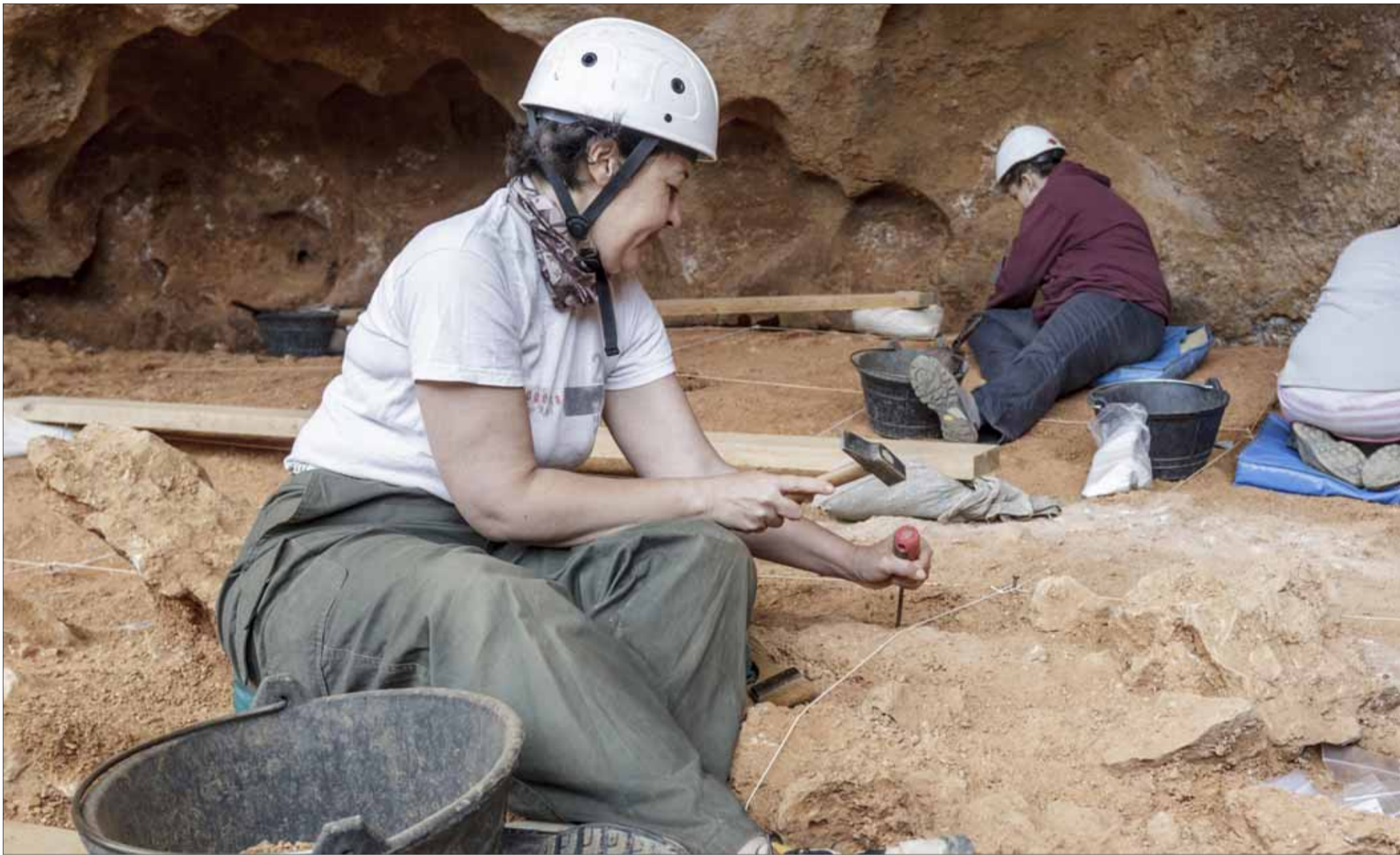
Tres personas desarrollan labores de excavación en el yacimiento de Galería en la Sierra de Atapuerca. SANTI OTERO