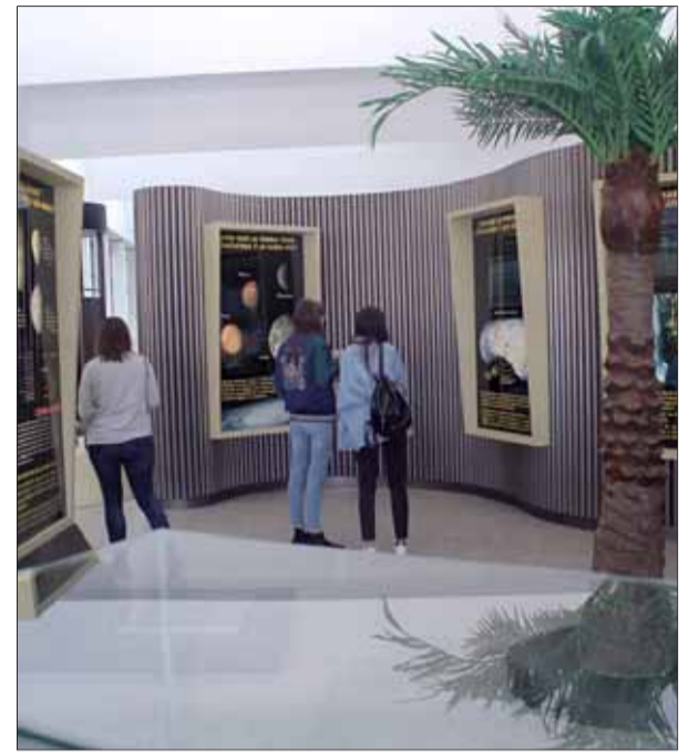
pasión del hombre por alcanzar las cimas más altas y lo que la montaña evoca en él desde antiguo. Sala de exposiciones temporales del MEH. Visitas didácticas a las 13 y las 19 horas.

De Excalibur a los agujeros negros. Una de las fuerzas que determina la estructura del cosmos es la gravedad. Esta exposición propone un viaje a al mundo en que vivimos y al Universo explorando multitud de fenómenos que dependen de la gravedad. Visitas didácticas a las 12.30 y a las 18.30 horas. Planta 2 del MEH. Entrada gratuita.