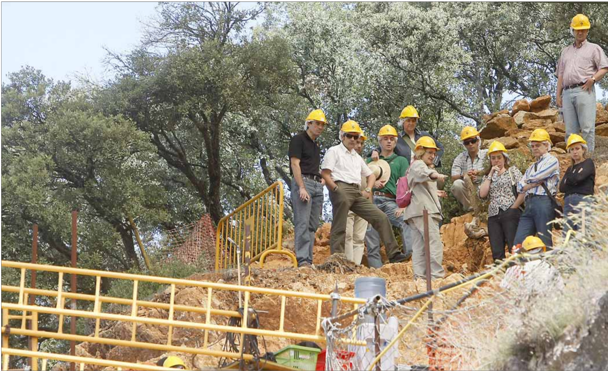
Un grupo de visitantes en los yacimientos de la sierra de Atapuerca.