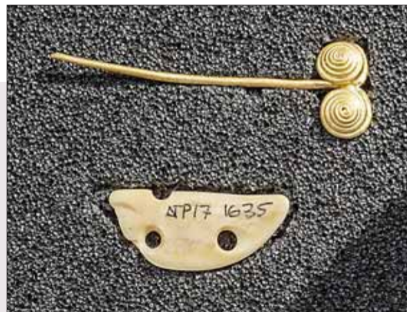
Aguja descubierta en las excavaciones.

ponsable del complejo de Cueva Mayor, Juan Luis Arsuaga, estos hallazgos confirman «la gran riqueza y versatilidad de todos los yacimientos que se trabajan en Atapuerca y cómo cubren toda la historia».