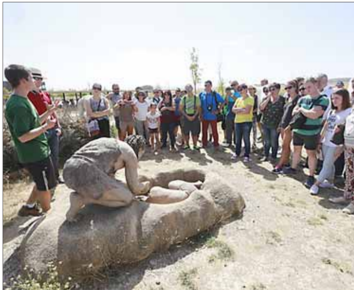
Un grupo de visitantes en el Carex.

No obstante, la diferencia entre los visitantes que reciben unos y otros tiene una explicación; y es que con el paso de los años la organización de las visitas a los yacimientos y demás actividades se ha ido acercando a la capital burgalesa. Esto se podría corresponder a la 'reciente' construcción del Museo de la Evolución Humana, por el que ahora las visitas a las