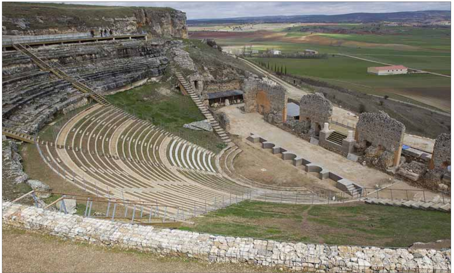
Vista general del teatro romano de Clunia.

No obstante, el último descubrimiento realizado corresponde a un monumento funerario que puede pertenecer, aunque no se sabe con certeza, a los siglos «I-II d.