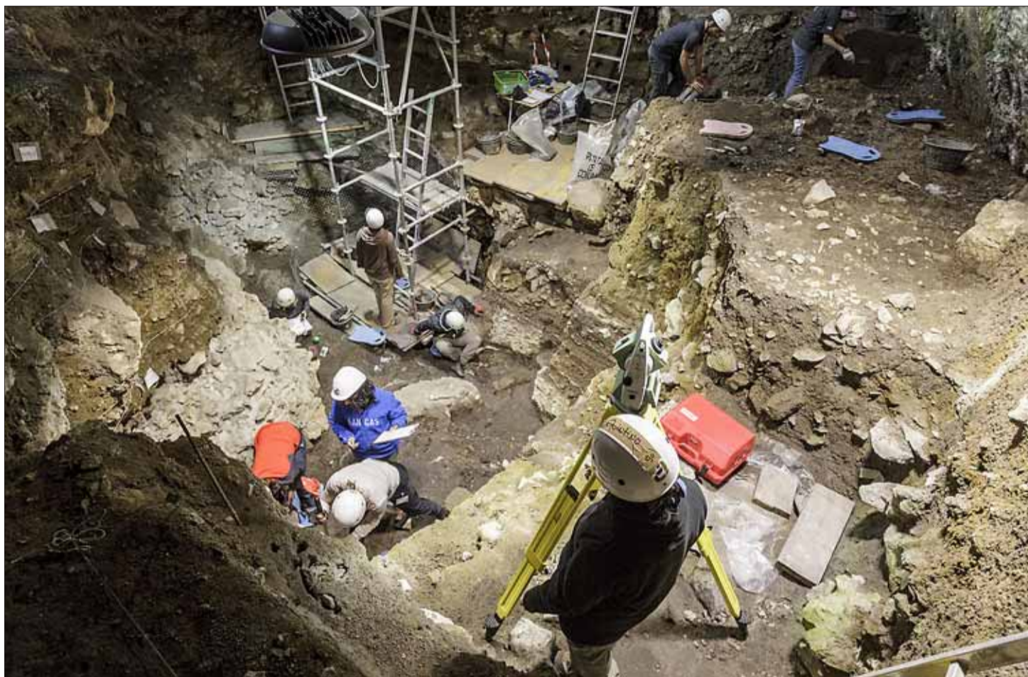
Vista general de los trabajos que se desarrollan en el Portalón. SANTI OTERO