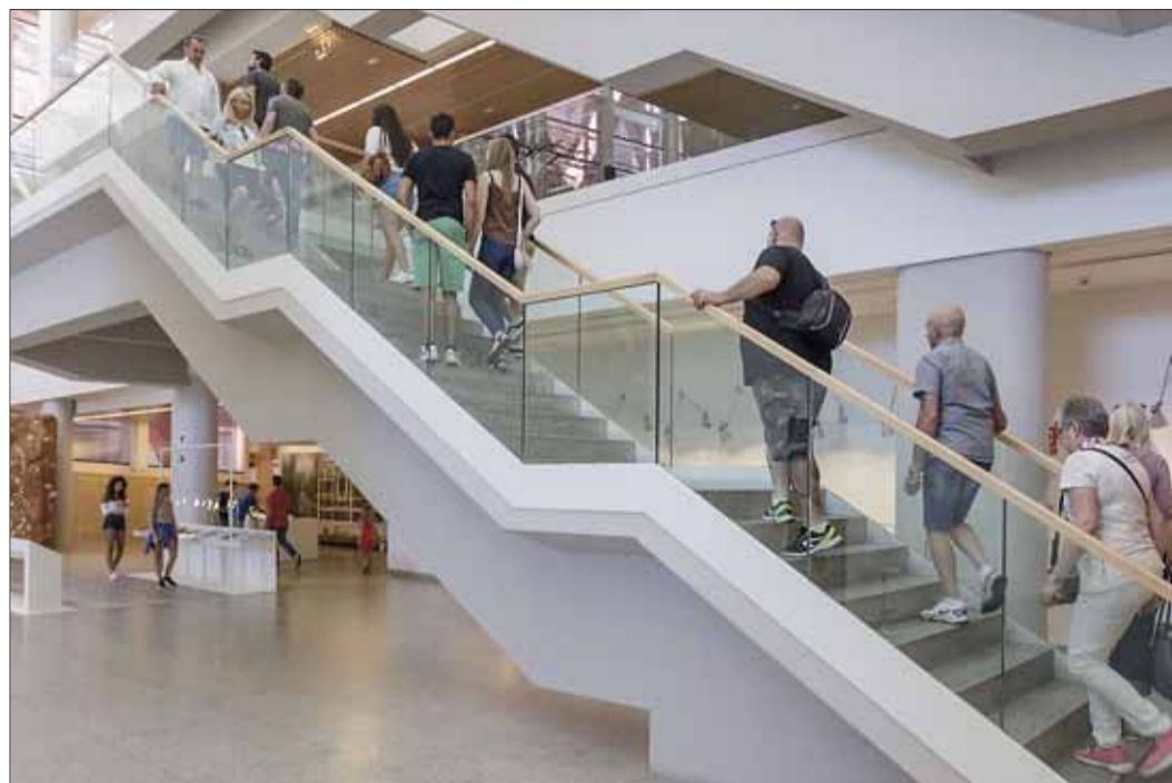
Un grupo de personas, en las escaleras del MEH.