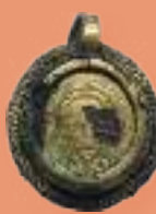
Medalla con el rostro de Jesús H. 1600 MBU-9292.5