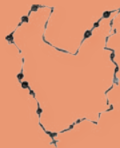
Fragmento de rosario S. XVII MBU-9292.8

Piezas recuperadas en la excavación del convento de San Pablo