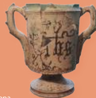
Copa S. XV MBU- 9292.1