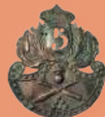
Aplique 5º Regimiento Artillería S. XIX-XX MBU-9292.7