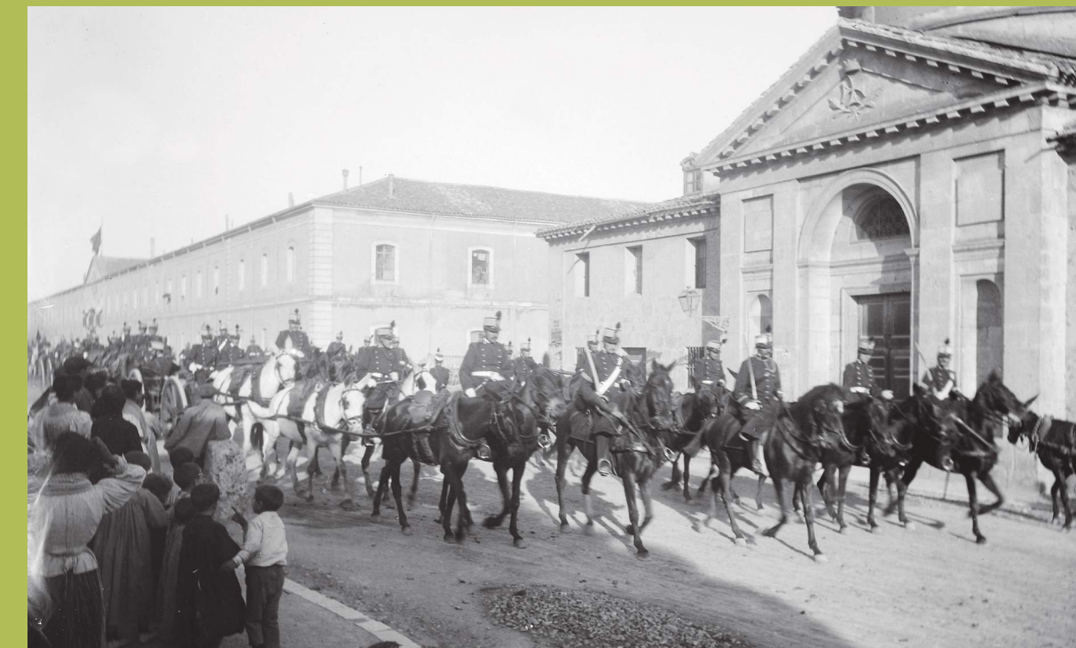
Desfile militar. Cuartel de Caballería al fondo. 1897.

El cuartel fue vendido por Defensa al Ayuntamiento en 1972, que procedió a su demolición en 1976.