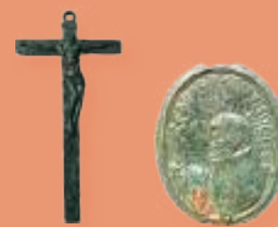
Colgante con crucifijo y medalla de San Carlos Borromeo H. 1610-1620 MBU-9292.2