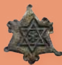
Pinjante con la estrella de David S. XIV-XV MBU-9292.3