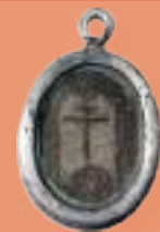
Colgante relicario H. 1600 MBU-9292.4