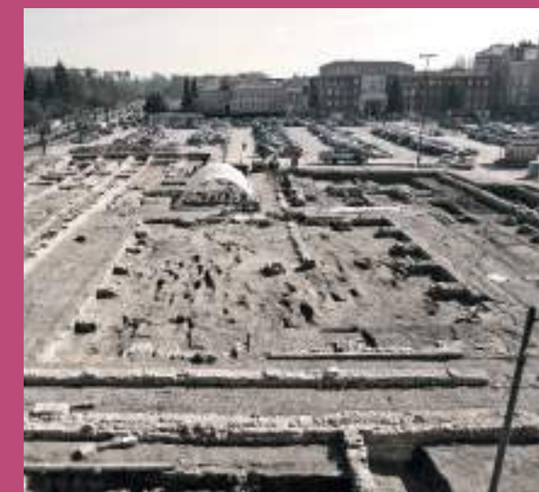
Diario de Burgos. Alberto Rodrigo.