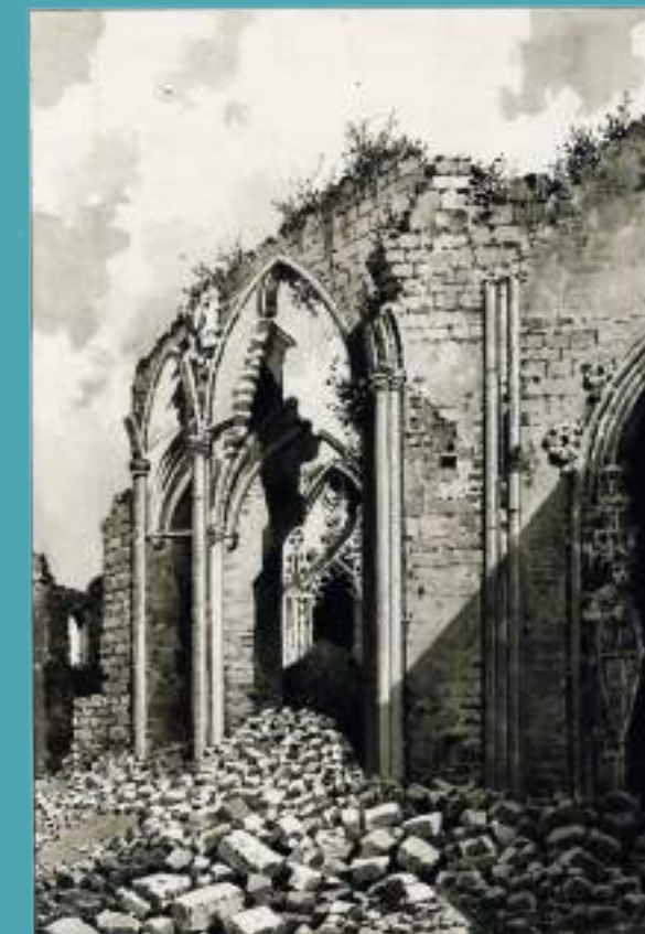
Ruinas de la iglesia del convento de San Pablo de Burgos. Isidro Gil. Archivo Municipal de Burgos.

En 1842 el Ministerio de Guerra adquirió el solar del convento para destinarlo a cuartel de Artillería.