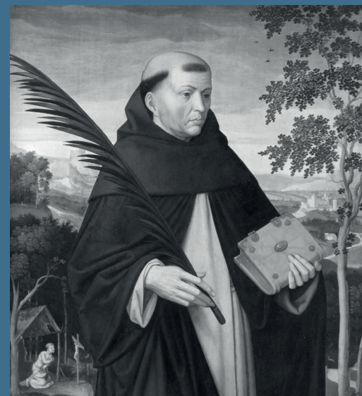
Santo Domingo de Guzmán (c.1528). Ambrosius Benson.

Vinculados a este convento se podría destacar a: Andrés de Miranda, Francisco de Vitoria, Domingo de Soto, Diego de Mardones o Juan Guemes.