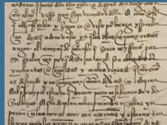
Fragmento facsimil Leyes de Burgos

A instancias reales, en 1512 se reunió en el convento una junta de teólogos y juristas al objeto de estudiar las denuncias de los dominicos sobre el trato que se daba a los indígenas. De ahí salieron las conocidas como Leyes de Burgos. Sancionadas el 27 de diciembre de 1512 por Fernando el Católico, constituyeron el primer cuerpo legislativo de carácter universal que se otorgó para los nativos del continente americano.