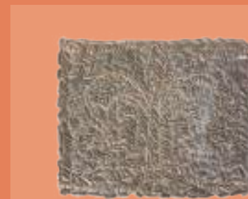
Fragmento de empedrado con el escudo dominico S. XVI MBU-10150.1

En los años 2002 y 2003, tras unos sondeos preliminares, se llevó a cabo una excavación integral para analizar la secuencia constructiva del convento y recuperar los restos arqueológicos. En el estudio de estos últimos colaboraron equipos de la Universidad de Burgos y del Centro mixto (UCM-ISCIII) de evolución y comportamiento humanos.